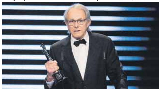
Regizorul britanic Ken Loach

tre favoriții Cannes-ului. Ken Loach a participat la festival de mai mult de zece ori și a câștigat Palme d'Or în 2006 cu pelicula The Wind That Shakes The Barley . Acțiunea peliculei Route Irish se desfășoară în timpul războiului din Irak, unde conducătorul unei firme de pază și protecție vrea să afle adevărul despre decesul unui prieten. 19 pelicule se luptă anul acesta la Cannes, care are loc între 12 și 23 mai, pentru marele premiu - Palme d'Or . Festivalul s-a deschis cu premiera mondială a peliculei Robin Hood , regizată de Ridley Scott. Printre regizorii care concurează cu Loach se numără Alejandro González Iñárritu, Mike Leigh, Bertrand Tavernier și Nikita Mikhalkov.