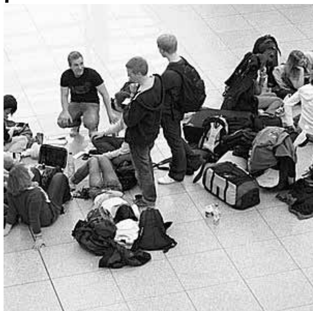
Aeroporturi din Marea Britanie, închise din cauza norului de cenușă