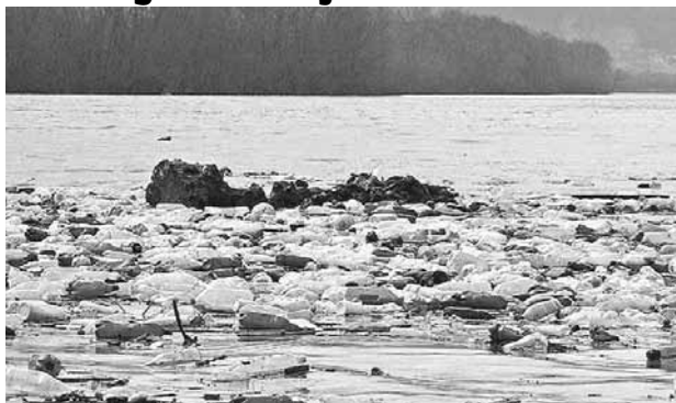
Poluarea cu PET-uri și alte gunoaie este veche

ORȘOVA. Zeci de tone de PET-uri, furaje, coceni și bucăți de copaci au fost aduse de apele învolburate ale râului Belareca în Dunăre, în dreptul localității Orșova-Mehedinți, în urma ploilor abundente, transmite corespondentul NewsIn. Problema poluării cu PET-uri și alte gunoaie este veche, autoritățile din Orșova confruntându-se cu astfel de incidente încă din 2004, de câte ori plouă abundent. PET-urile și gunoaiele provin din localități riverane Dunării din județul Caraș-Severin. În aceste localități nu sunt gropi de gunoi și localnicii aruncă gunoaiele în albia râului.