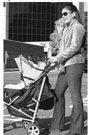
Critică decizia guvernului

BUCUREȘTI. Mamele se pregătesc de protest. Revoltate că guvernul va reduce cu 25 la sută indemnizația pentru creșterea copilului, ele își vor striga astăzi supărarea la Ministerul Muncii. Ele vor veni la protest cu bebeluși în cărucioare, pampersși și banderole negre, în semn de doliu pentru „înmormântarea” pe care o pregătesc guvernării. Intenția executivului a stârnit revoltă inclusiv în interiorul partidului de guvernare. Organizația de femei a PDL critică intenția lui Emil Boc de a reduce veniturile mamei. Femeile cer Guvernului să nu se atingă de indemnizația de creștere a copilului.