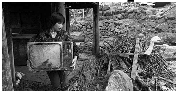
Inundațiile le-au distrus casele

Peste 400 de localități au fost afectate de inundațiile din centrul Chinei. În total, aproape un milion de persoane au avut de suferit din cauza apelor. Oamenii spun că acesta este cel mai mare dezastru din ultimii 20 de ani. Nivelul râurilor a