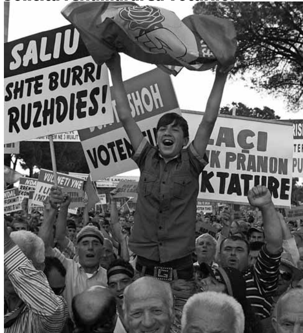
Manifestația a fost organizată de Partidul Socialist

TIRANA. Zeci de mii de persoane s-au strâns sâmbătă la Tirana pentru a cere renumărarea voturilor din alegerile de anul trecut. Manifestația a fost organizată de Partidul Socialist, de opoziție, ca susținere a militanților socialiști aflați în greva foamei de două săptămâni în fața biroului premierului Sali Berisha. Partidul lui Berisha a câștigat la limită alegerile din iunie 2009 și are 75 de locuri din cele 140 din Parlament. Guvernul