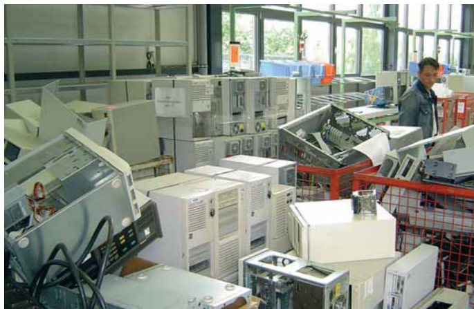
Elektroaltgeräte werden wiederverwertet.

Rheinberg und Oberberg - BAV: 0800/805805-0