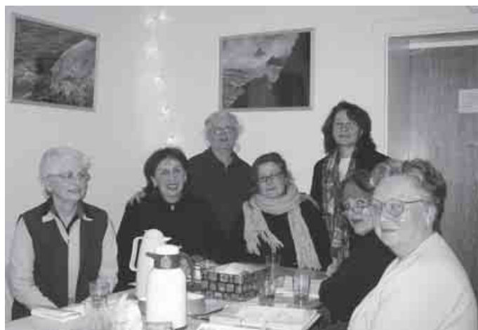
Die Irak Hilfe Oberberg – Frauen helfen Frauen – überreichten 3000 Euro für die Einrichtung eines Frauenzentrums in Nusaybin.