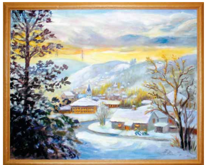
Wintermotive sind zur Zeit in der Rathausgalerie zu sehen.