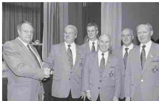
Auch der MGV „Eintracht“ Morsbach stellte bei der zentralen Ehrung wieder verdiente Sänger.