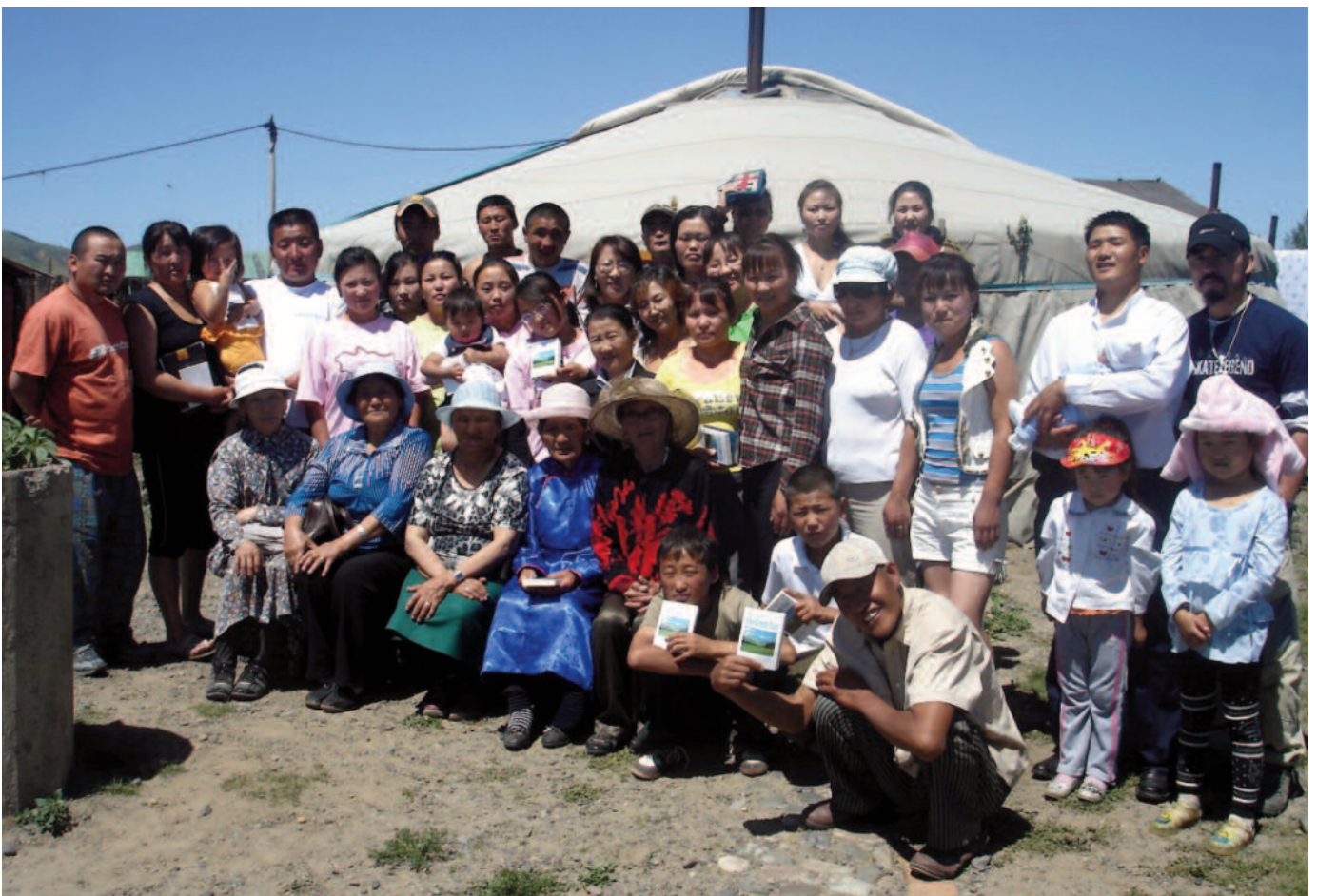
Team från MMC reser ut i olika delar av landet för att uppmuntra unga församlingar.

Varma hälsningar från oss alla på Mongolian Mission Center i Erdenet