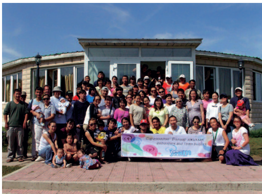
Sjuttiofem personer deltog i UMUs årliga konferens för anställda inom MMC.

I år har vi upplevt ett visst motstånd från regeringen då vi inte fick tillstånd att ha vårt läger för seniorer på den plats där vi brukar vara. Vi fick hitta en annan plats, ej subventionerad av kommunen. Inte mindre än 76 äldre personer, alla över 60 år, deltog i olika aktiviteter. De njöt av gemenskapen i naturen, spelade spel, åt traditionell mat samt ägnade sig åt gemenskap med varandra. Guvernören själv var