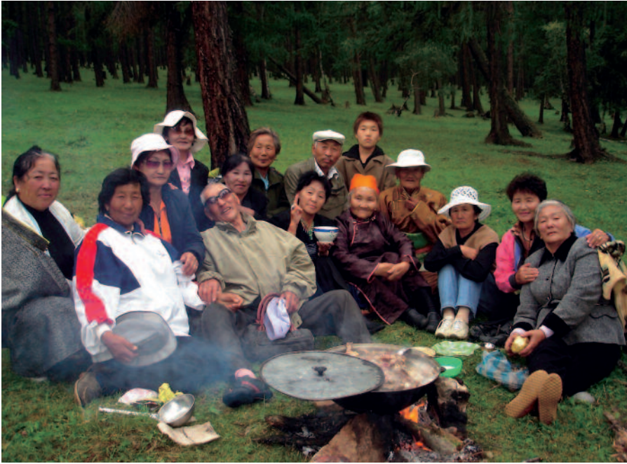
Lägerverksamhet för kommunens äldre invånare anordnad av MMC.

tillsammans med oss en dag och uttryckte sin tacksamhet över att vi kunnat göra detta för kommunens äldre invånare.