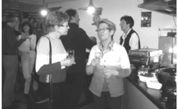
Ausgiebiger Apéro-Smalltalk (oben) und das Harren auf die Dinge (sprich Raclette), die da gereicht werden.