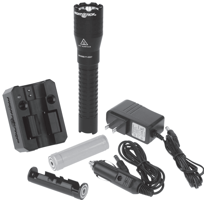
Included in the box - Compris dans la boîte - Incluido en la caja

Please read these instructions before using your 9844XL. They include important safety and operation information. Be sure to charge the 9844XL fully before the first use. A battery is fully charged when the charger light is green.