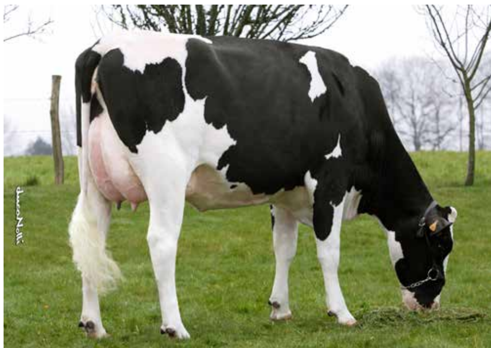
CDHM UNIE, arrière-grand-mère de HESKA