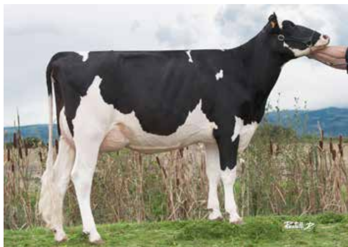
FERTILEPOM, mère de HOLLYPOM

La rencontre des Naurine et des Benarlinda, couronnées par un des rois de la morpho ! Une Van Gogh prête à collecter !