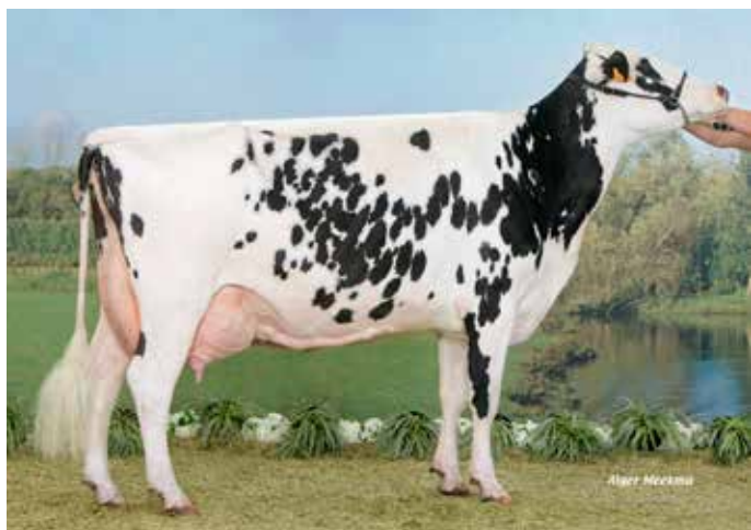
AGATE, grand-mère de HANINA EHB