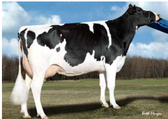
Wabash-Way ARLEIGH-ET, grand-mère de ROSITA