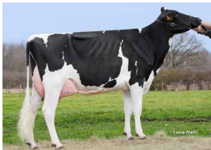
ELNINA EHB, mère de HANINA EHB