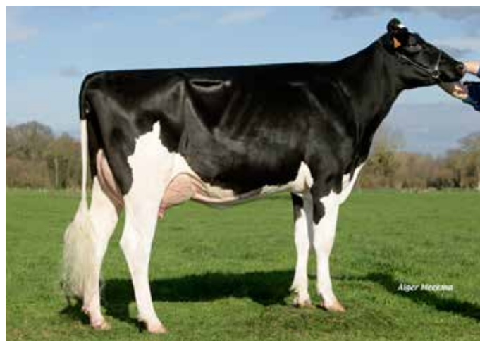
ELLATWO, mère de ILLATWO

Des pères confirmés et originaux + une souche confirmée et solide = vos futurs atouts génétiques