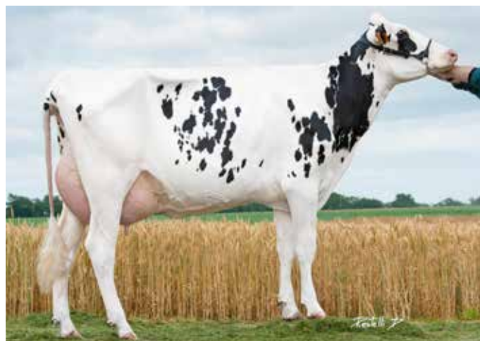
LVELLE, mère de LV HATROY