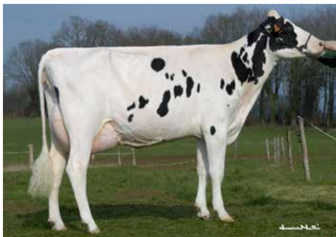
CDHM-TRACY, arrière-grand-mère de HAIDA