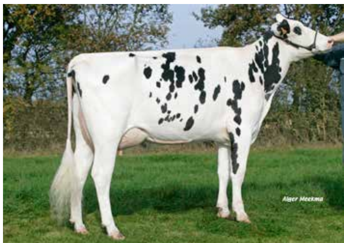
ATEILLA, grand-mère de HALTAYA