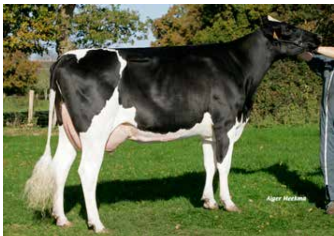
ALLESOCKO, grand-mère de ILLATWO