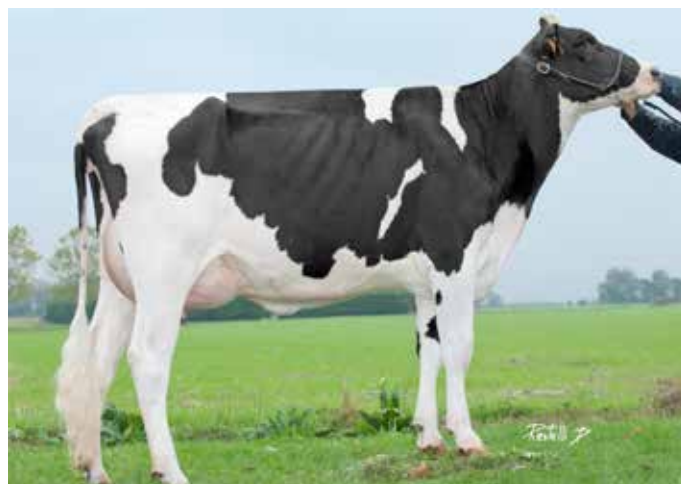
DEGAINE, mère de HEUREPOM