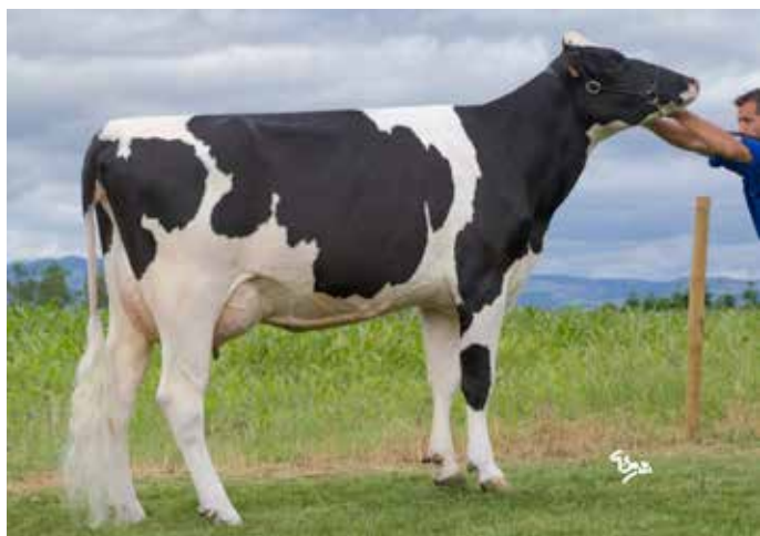
VALE, arrière-grand-mère de HEUREPOM