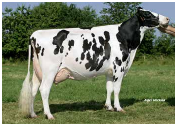
ARIME, grand-mère de HAIDA