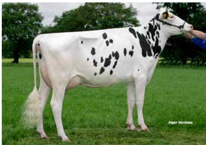
BELLE, grand-mère de LV HATROY