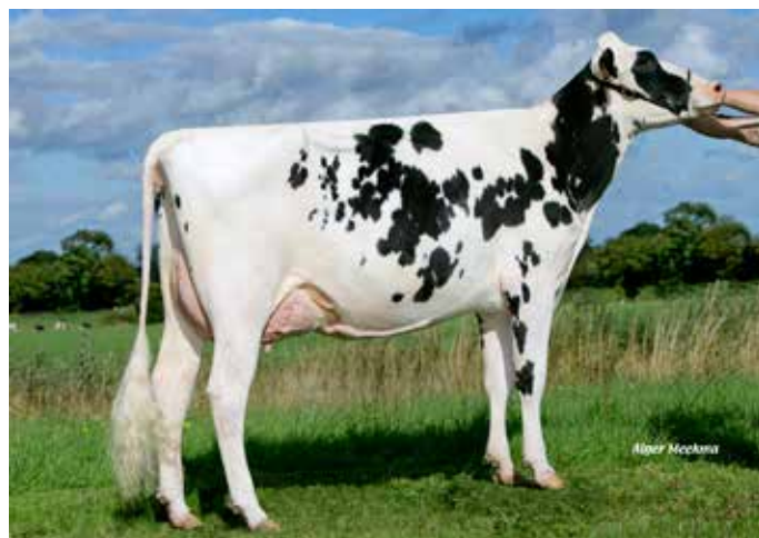
FLORIDA, mère de HALTAYA