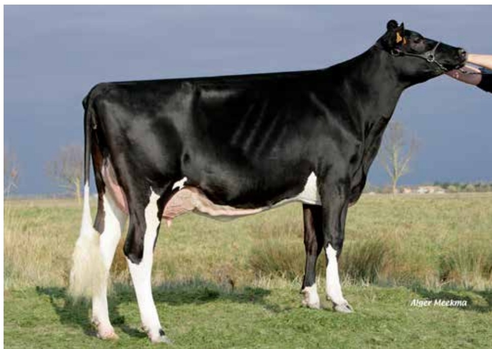
EUROPE GPB, mère de HEPSY GPB