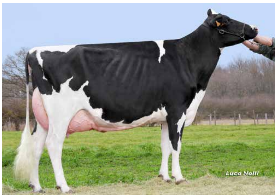
NOTE EHB, mère de HAITI EHB

Une des premières Famous Man disponible dans l'Ouest aux origines profondément ancrées dans les schémas de sélection