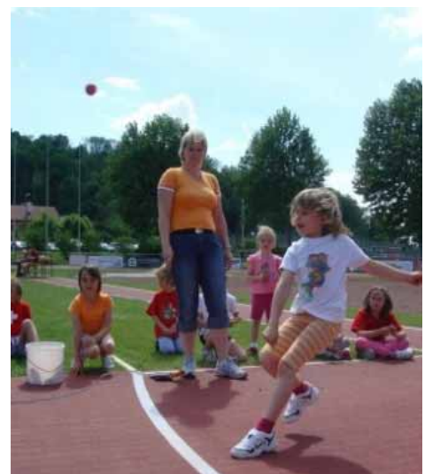
...und alli Chraft in Wurf lege.