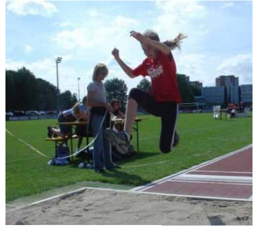
D Athlete hän alles gäh...