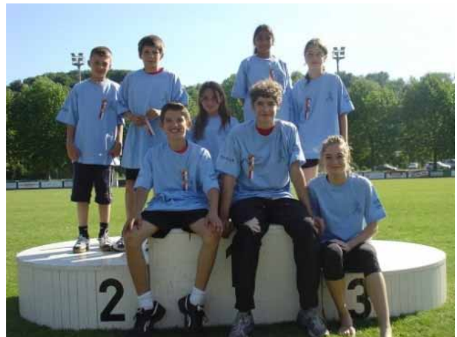
Di schnällschte Muttenger 2007