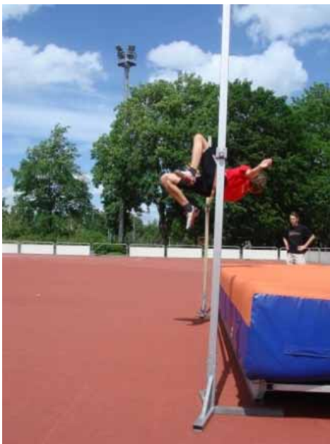
...und ihr Könn bewiise.