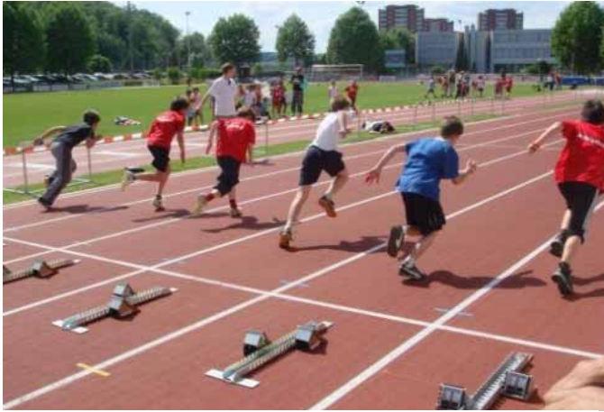
Bi wunderschönem Wätter het dr Wettkampf chönne aafoh.