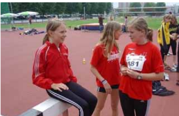
Während em Wettkampf...