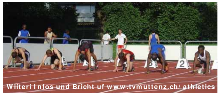
Wiitleri Infos und Bricht uf www.tvmuttENZ.ch/athletics

Alli Bilder und Täxt vo de drei athletics-Syte stammed vo dr Nadine Schrutt.