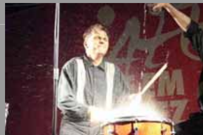
Jazz uf em Platz