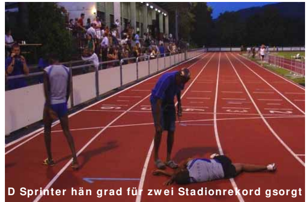
D Sprinter hän grad für zwei Stadionrekord gsorgt