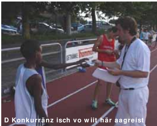
D Konkurrenz isch vo wiit här aagreist

Alli Bilder und Täxt vo de drei athletics-Syte stammed vo dr Nadine Schrutt.