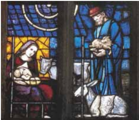
Weihnachtsmotiv in der St- Veit-Kirche