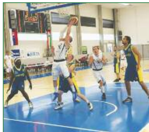
Támadnak a komáromiak (fehérben) A felvétel a Highlanders – Domov Topolčany mérkőzésen készült