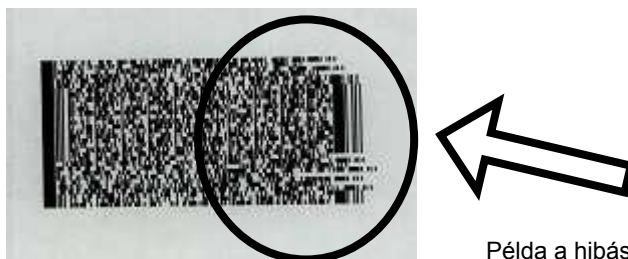
Példa a hibás, el nem fogadható vonalkódra.

Előfordul, hogy a vonalkód sérült, ekkor kérjük, ismétlje meg a kérelmlap kinyomtatását. Ha a hiba még mindig fennáll, akkor töltsse ki újra a nyomtatványt.