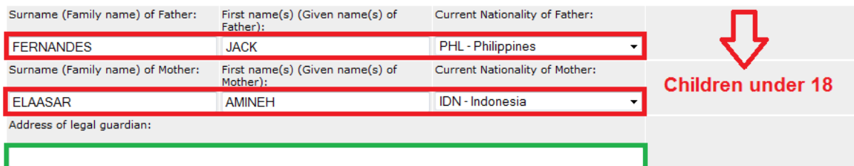
3-2: Parents or legal guardian